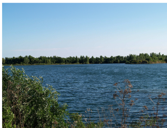
2. ábra: A nem művelt bányarész