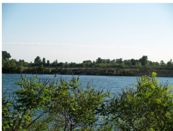
1. ábra: A művelt bányarész