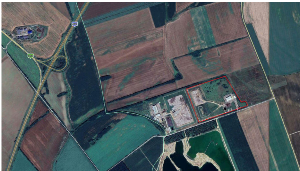
6.1. ábra: Az NHSZ Észak-KOM Nonprofit Kft. Hejőpapi 073/5 hrsz. alatti telephelye és környezete

A telephely elhelyezkedését a 6.1. ábrán található helyszínrajzon bejelöltük.